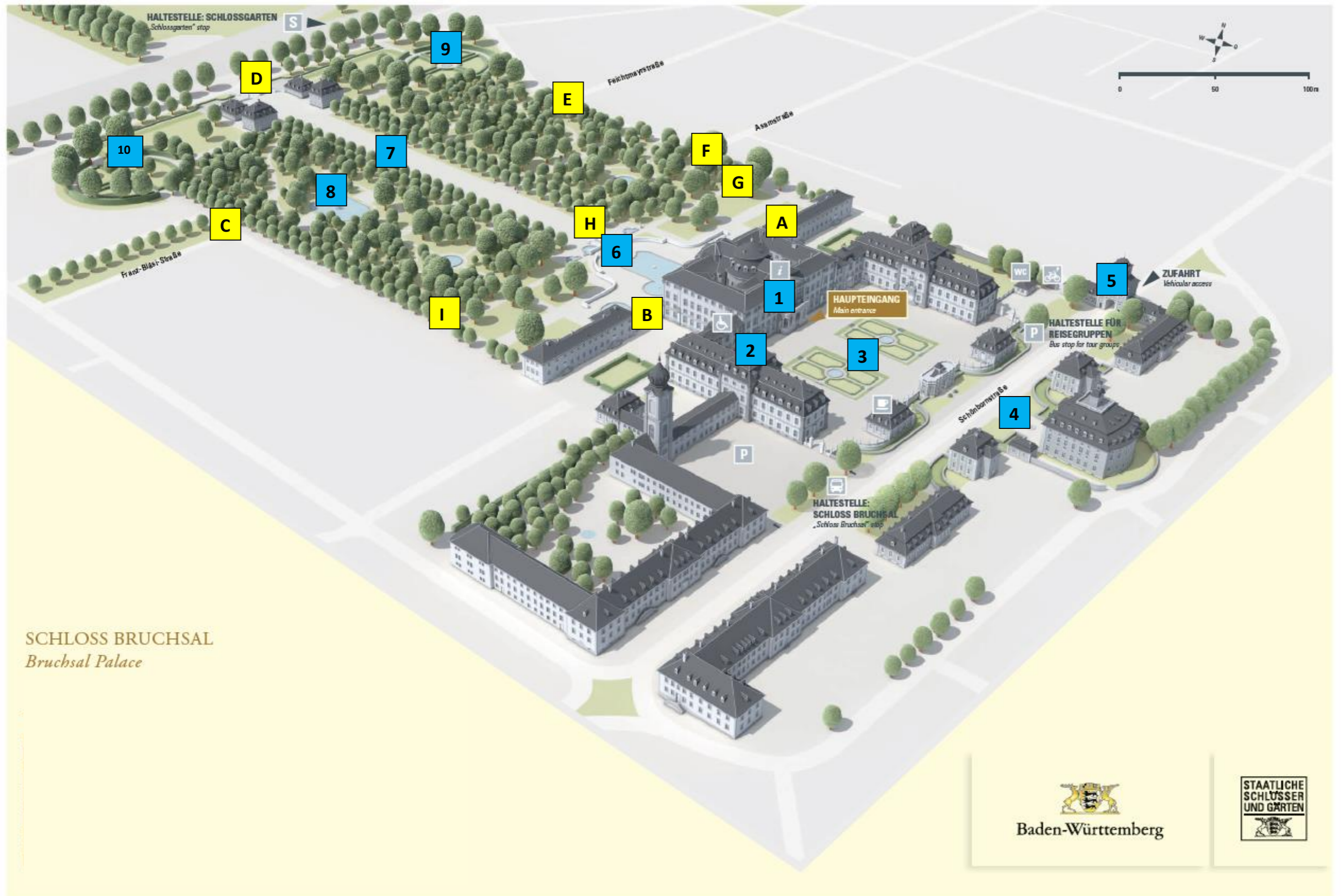
SCHLOSS BRUCHSAL Bruchsal Palace